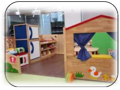
冷蔵庫や電子レンジもあり、美味 しいごちそうが作れます