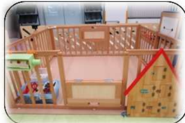
サークルの中で線路をつなげて 電車あそびができます