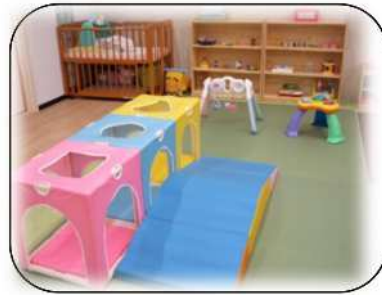
赤ちゃんがハイハイで トンネルや山を登れます