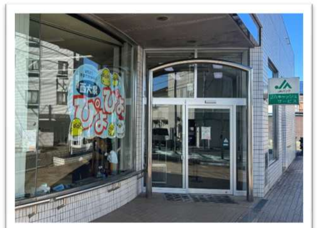
西大泉びよびよ入口