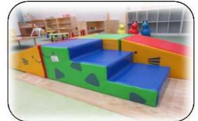
階段や色々な斜面を登ったり降り たりして楽しめます