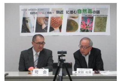
オンラインで開催した 「練馬区食の安全・安心講演会」

区民、食品等事業者、行政関係者が質疑応答等を通じ意見交換を行い、それぞれの立場に対する理解を深めることにより、食の安心確保を図ります。