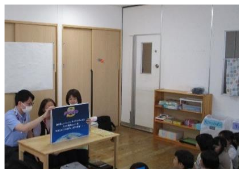
「食の安全教室（手洗い教室）」 の様子