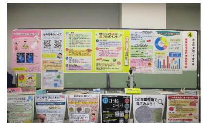
「消費生活展ねりま」 でのパネル展示

区民の食品衛生意識の向上のため、要望に応じて食品衛生出前講習会を実施し、食品衛生に係る情報を提供します。また、庁内他部署の実施するイベントに出展し、来場する消費者に対して積極的に食品衛生知識の普及啓発を行い、食品による健康被害発生の防止に努めます。