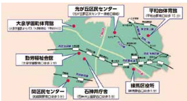
▲平成19年に大泉学園町体育館が期日前投票所に追加され、現在の態勢となりました。

期日前投票所を設置するには、十分な広さがあり、突発の選挙であっても最短でも1週間は貸し切りできる施設でなければなりません。また、投票所を運営するための職員も多く必要です。