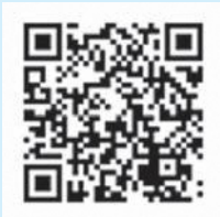
公式YouTubeチャンネルはこちらから

新型コロナウイルス感染症の影響により、人が集まる場所での選挙啓発活動が難しい中、若者の身近なコンテンツであるYouTubeを活用し、若年層の投票率向上を図っていきます。 投票日や投票所など選挙に必要な情報、寄附禁止など公正な選挙執行のための情報、明るい選挙推進委員の活動紹介など幅広い分野で動画を作成していく予定です。