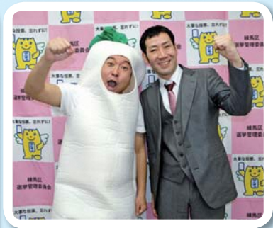
練馬区選挙啓発大使「ねりまだいこん。」のお二人

新型コロナウイルス感染症の影響により、人が集まる場所での選挙啓発活動が難しい中、若者の身近なコンテンツであるYouTubeを活用し、若年層の投票率向上を図っていきます。 投票日や投票所など選挙に必要な情報、寄附禁止など公正な選挙執行のための情報、明るい選挙推進委員の活動紹介など幅広い分野で動画を作成していく予定です。