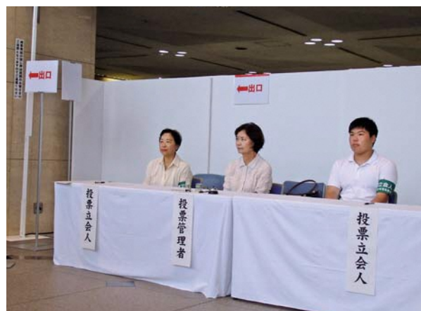
▲ 期日前投票所の投票立会人