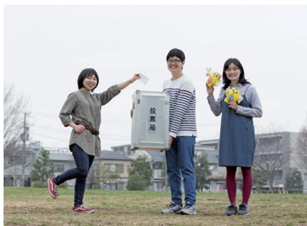
▲ 選挙啓発サポーターの皆さん