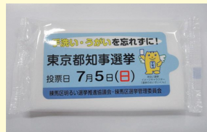
ウェットティッシュ