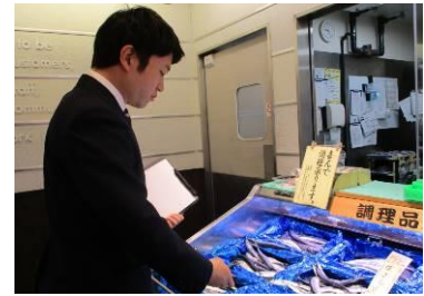
店頭での監視の様子