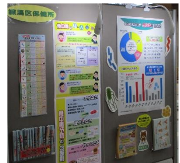
「くらしのフェアパネル展」への参加

区民の食品衛生意識の向上のため、要望に応じて食品衛生出前講習会を実施し、食品衛生に係る情報を提供します。また、庁内他部署の実施するイベントに出展し、来場する消費者に対して積極的に食品衛生知識の普及啓発を行い、食品による健康被害発生の防止に努めます。