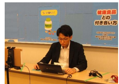
オンラインで開催した「練馬区食の安全・安心講演会」

区民、食品等事業者、行政関係者が質疑応答等を通じ意見交換を行い、それぞれの立場に対する理解を深めることにより、食の安心確保を図ります。