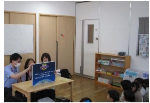
「食の安全教室（手洗い教室）」の様子