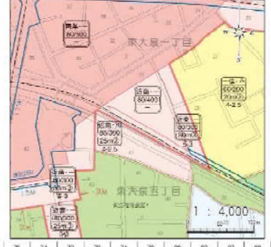
練馬駅北口周辺拡大図