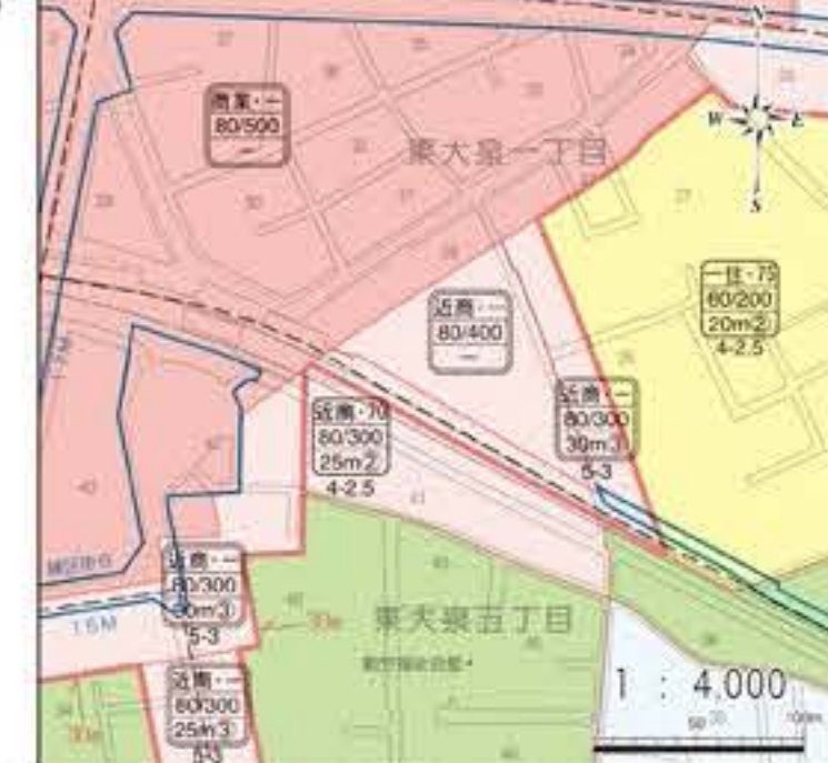
練馬駅北口周辺拡大図