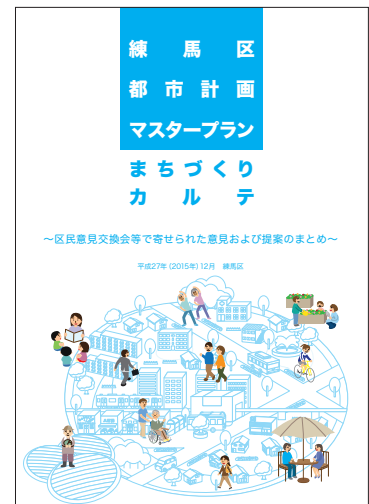
まちづくりカルテ

前都市計画マスタープランの地域別指針の地域カルテの「カルテ」を継承し、名称を「まちづくりカルテ～区民意見交換会等で寄せられた意見および提案のまとめ～」としました。