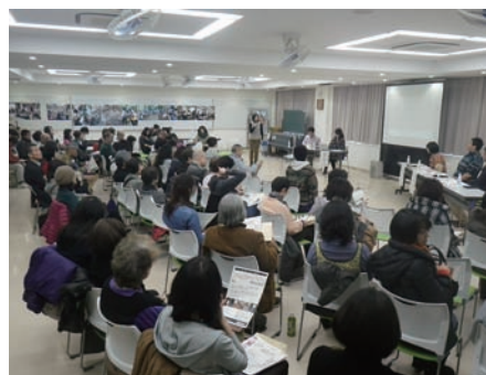
まちづくり講座「私たちの居場所づくり」

これからのまちづくりの担い手となる若い世代が楽しみながらまちと関わる方法やそのアイデア等、テーマに沿ったゲストを招いて事例を紹介しながら、参加者同士による意見交換を行いました。