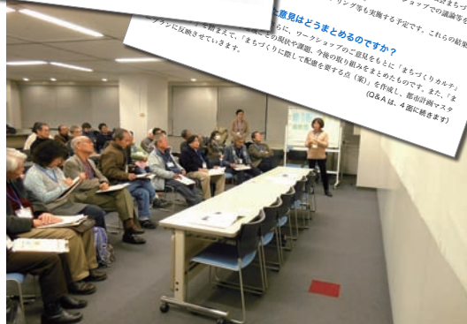
左上：区民意見交換会の話し合い 上：区民意見交換会募集ちらし 右上：区民意見交換会ニュース 右下：まとめの会