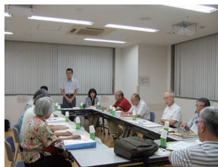
区政モニター懇談会（石神井）

その区政モニターの方に、「ねりまらしさ」について、またそれをどの様にまちづくりに活かし、住みやすいまちにするか等について、自由にご意見をいただきました。