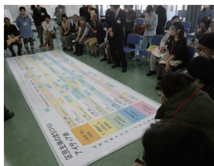
第2回ねりまちコレカラ集会

これから10年間の練馬における「住民主体のまちづくり＝区民自らが主役となって出来そうなまちづくり」について考えました。