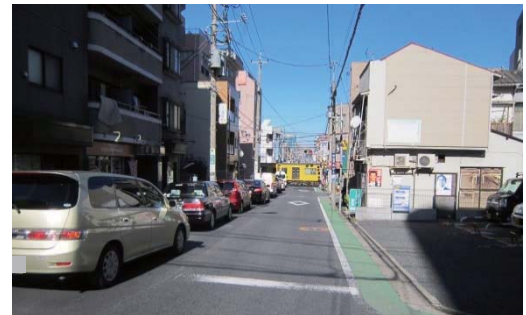
◆上石神井第8号踏切（写真左：北側より、写真右：南側より）