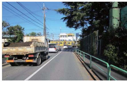
◆上井草第2号踏切（写真左：北側より、写真右：南側より）