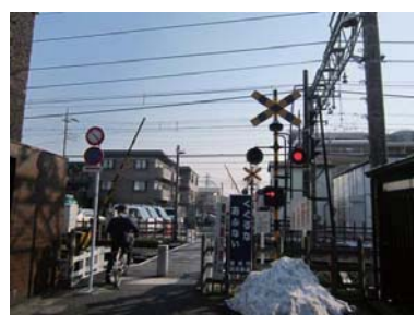
◆上石神井第6号踏切（北側より）