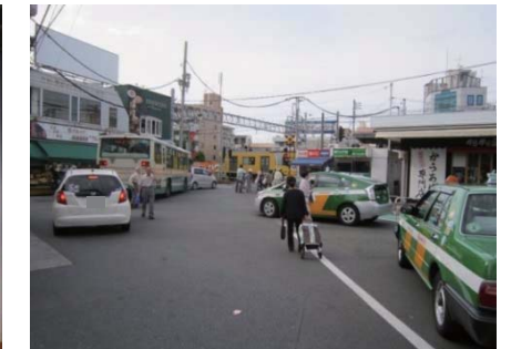
◆上石神井第1号踏切（写真左：北側より、写真右：南側より）