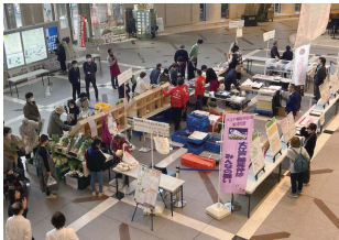
◎マルシェ de 延伸大江戸線