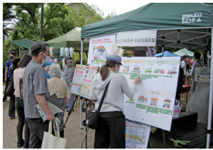
◎アニメプロジェクト in大泉への出展