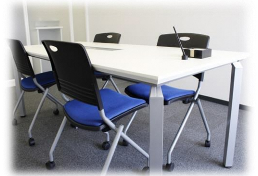
[相談ブース(イメージ)]