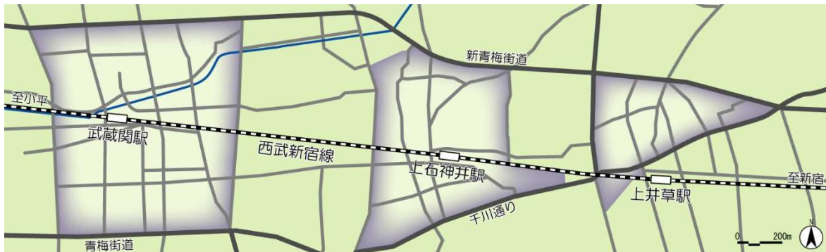
区内3地区のまちづくり構想エリア

今後は、各駅周辺地区のまちづくり構想の実現を目指すとともに鉄道の立体化の早期実現に向けて、3地区が連携を取りながらまちづくりを進めていく必要があります。