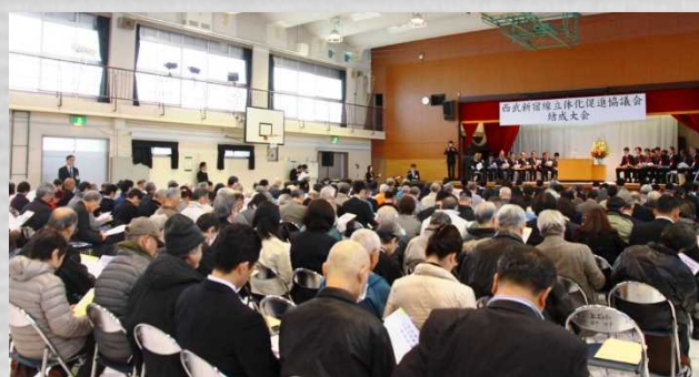
結成大会会場の様子