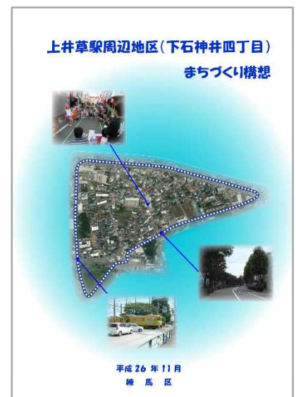
出そろった3地区のまちづくり構想（表紙）

※まちづくり構想は区役所に常備してあるほか、区のホームページにも掲載されていますので是非ご覧ください。