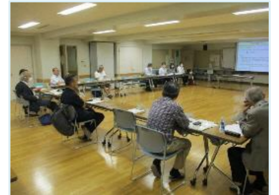
▼第11回まちづくり協議会の様子