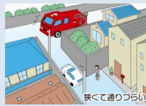
狭くて通りづらい