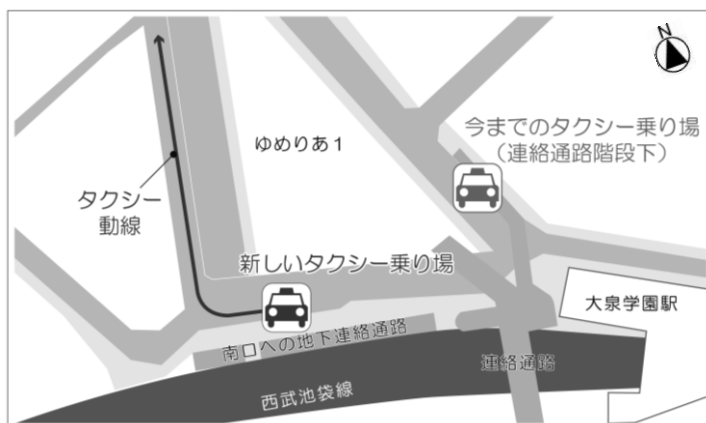
タクシー乗り場の位置図 ▲