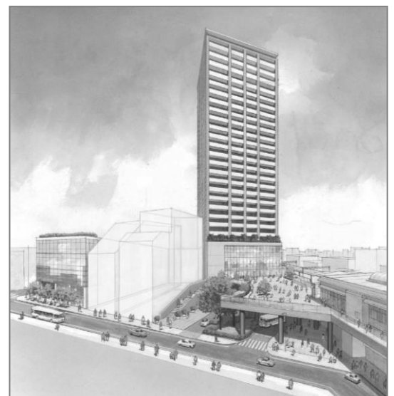
北口駅前ゾーンの開発整備のイメージ▲