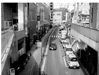
北口タクシー乗り場付近