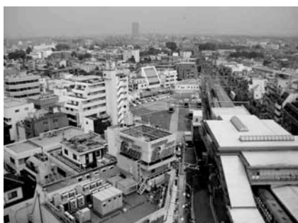
駅北口周辺の風景