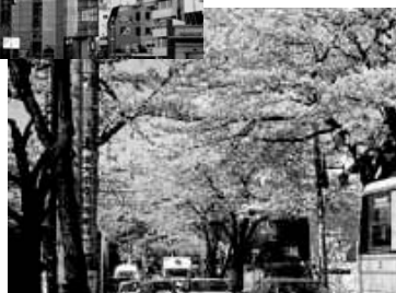
学園通りの桜並木