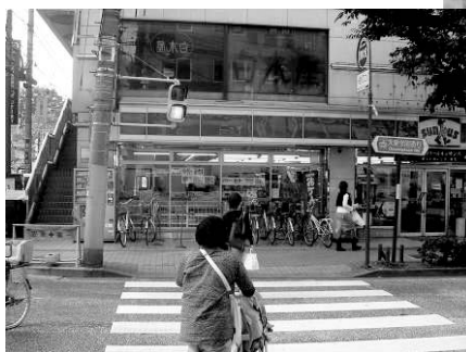
地元のみなさんと一緒に、要望し完成した横断歩道、信号機