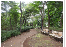
大泉町もみじやま公園