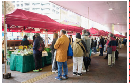
にぎわいの創出に向けたイベントの例