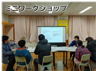
ミニワークショップ