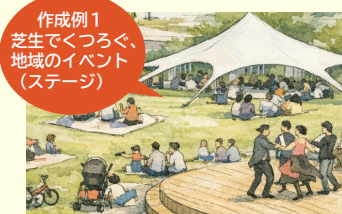
作成例1 芝生でくつろぐ、 地域のイベント (ステージ)

ミニワークショップでは、来場者の皆様が考える「駅前空間の使い方」をAIでイラスト化しました！