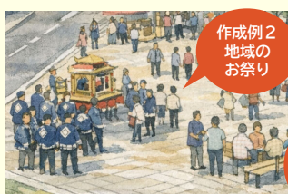
作成例2 地域のお祭り