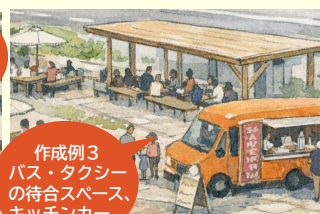
作成例3 バス・タクシー の待合スペース、 キッチンカー

「まちづくりだより」の内容に関して、ご意見・ご質問のある方は下記お問い合わせ先まで、ご連絡ください。 また、この「まちづくりだより」は地区内に土地・建物を所有されている方にもお送りしています。 所有状況に変更があった場合は、お手数ですがお問い合わせ先までご連絡ください。