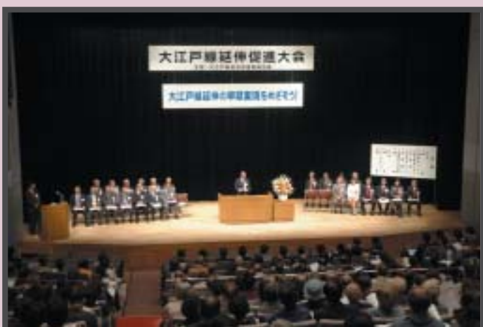
前回(平成18年)の大江戸線延伸促進大会の様子

期成同盟では、大江戸線の導入空間となる補助第230号線整備(土支田通り～大泉学園通り区間)の事業化を契機として、東京都などへ延伸の早期実現を強力に働きかけていくため“大江戸線延伸促進大会”の開催を予定しています。沿線町会・自治会の皆さまのご協力のほどよろしくお願いいたします。