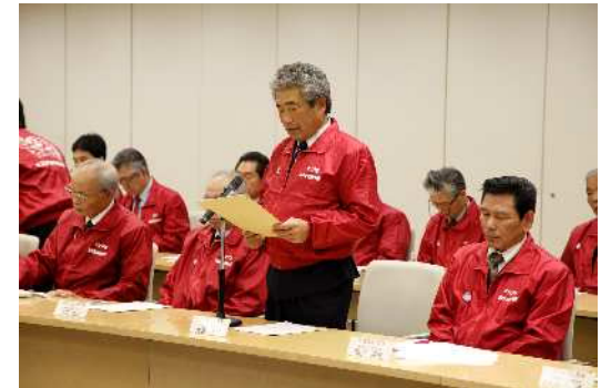
地域住民を代表して、(上)小川副会長、 (下)見留幹事が意見表明をしました。