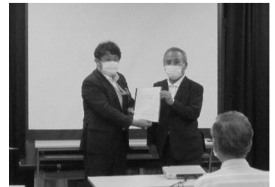
▲「まちづくり提言」 提出の様子

今後は、まちづくり提言を基に地区の将来像や、まちづくりの方向性を示す「重点地区まちづくり計画」の策定に向け、検討を進めていきます。