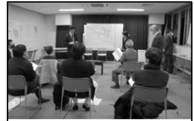
感染対策を施したうえで討議を行っています。