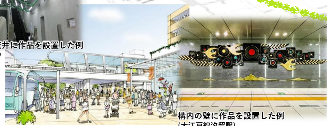
構内の壁に作品を設置した例 (大江戸線汐留駅)