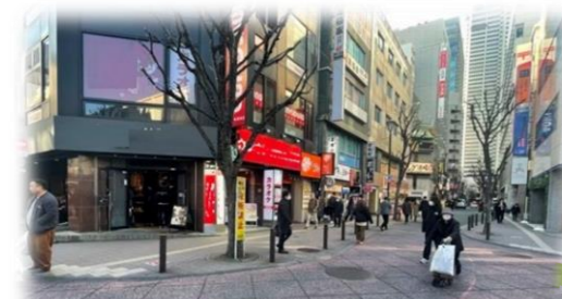
道路をインターロッキング舗装した例 (新宿駅西口プラザ通り)

美術館・図書館の設計者の監修のもと、まちと建物の装飾や整備などを一体的に行います。