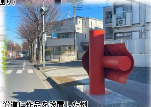
沿道に作品を設置した例 (キョセケヤキロードギャラリー)