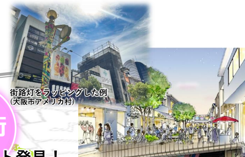
街路灯をラッピングした例 (大阪市アメリカ村)