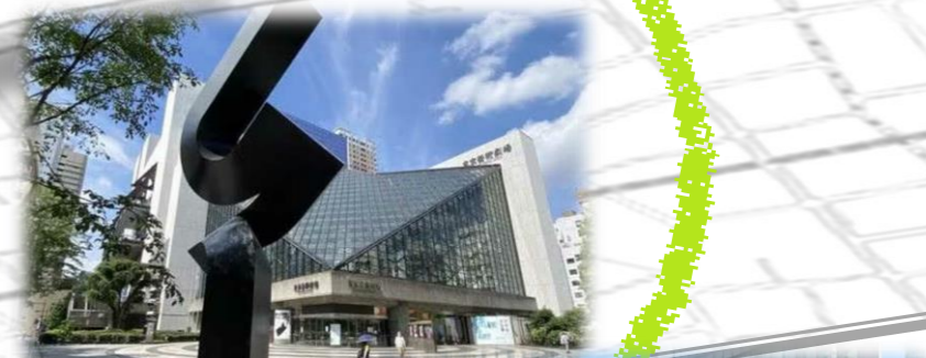
広場に作品を設置した例 (上: 東京芸術劇場前 下: 新宿駅東口駅前広場)