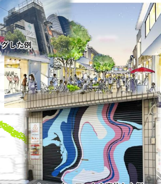
シャッターアートを実施した例 (日田市駅前通り商店街)