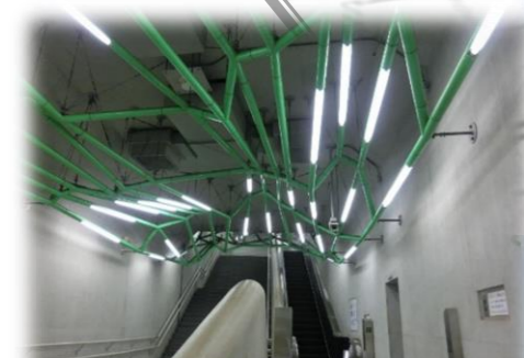
エスカレーター天井に作品を設置した例 (大江戸線飯田橋駅)