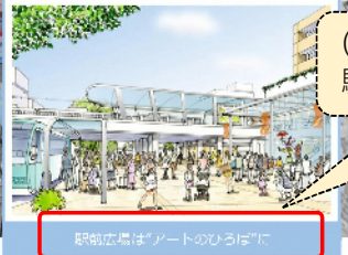
駅前広場は「アートのひろば」に