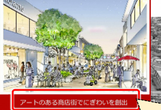
アートのある商店街でにぎわいを創出

美術館のリニューアルを契機に、 美術の森緑地と商店街・駅へと続く動線を一体的な景観として演出し、美術館のある街並みを創出します。 周辺エリア全体でアートを感じられる場となるよう再整備し、アートを軸とした人々の交流やにぎわいを生み出します。