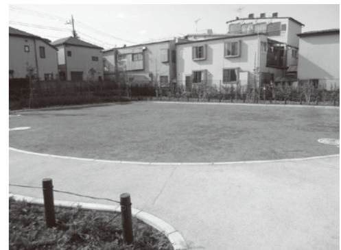
▲自由に走り回れる広場