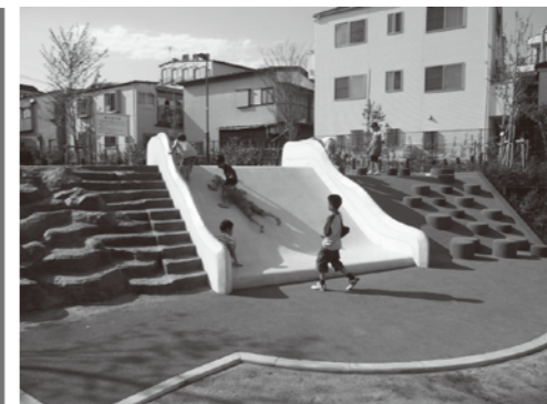
▲段差を利用した遊具