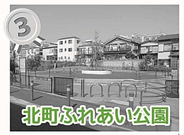
北町ふれあい公園

気に入っている主な理由 緑が多くて居心地がいい。 春は桜がきれいだから。 安全で、子供の手を離しても歩くことが出来るから。 お花見や散歩コース、ランニングコースとしてよい。 夏は涼しくて過ごしやすい。 植物や虫がたくさん観察できる。