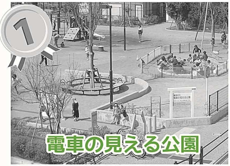
電車の見える公園

北町地区には、近年、密集事業で整備された公園などいくつかの公園・緑地があり、地域で親しまれています。そこで今回、地区祭の参加者や公園利用者に 最もお気に入りの公園・緑地 を投票してもらい、お気に入りの理由や、その他公園についてのご意見を伺いました。