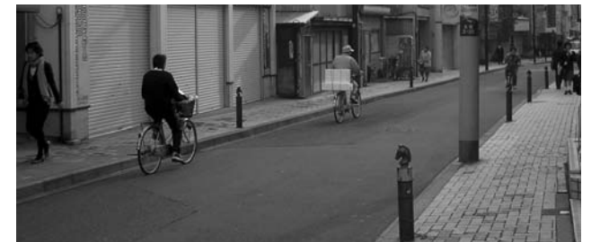
▲これまでの旧川越街道の様子。車道との段差が大きく、歩道もガタガタになっていました。