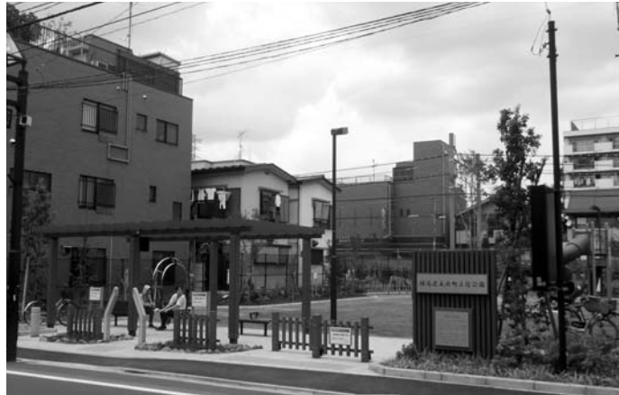
▲公園入り口の様子。格子デザインの園名板や自転車止めが特徴的です。