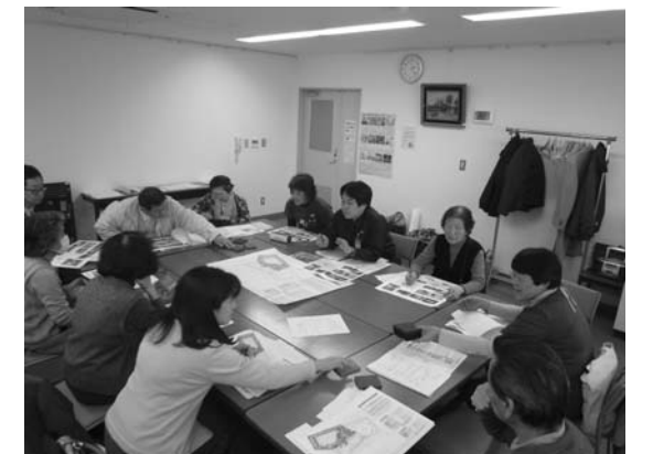
▲北町ふれあい公園 基本設計案の報告会の様子