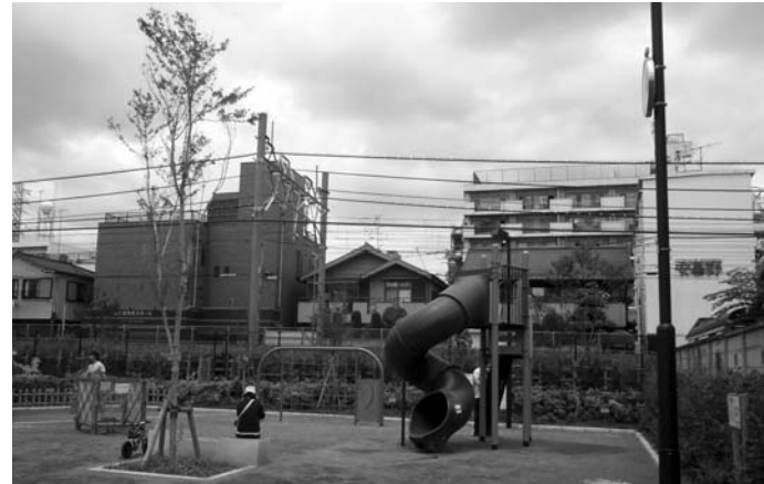
▲公園内の様子。子ども用の遊具と健康遊具が整備されています。