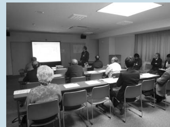
▲まちづくり講座の様子

また「住まいの相談会」を開催し、専門家が相談者を訪問する「出張相談」もあわせて実施しました。