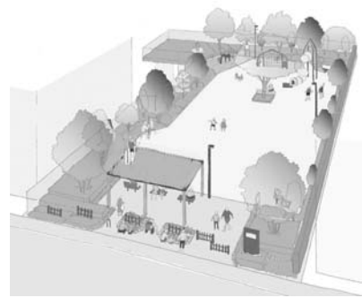
▲基本設計報告会にて、区から提示されたイメージパース。

区は提出されたまとめを踏まえ、基本設計を行い、ワークショップ参加者の皆様へ基本設計報告会を行いました。その後、実施設計・工事をを行い、このたび開園となりました。