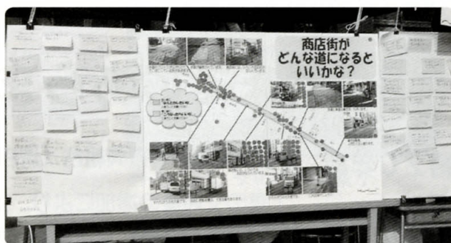
たくさんの意見が集まりました！