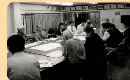
みちづくりの会の様子