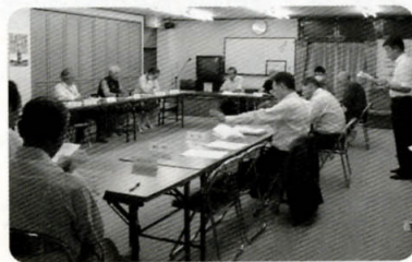
まちづくり委員会の様子