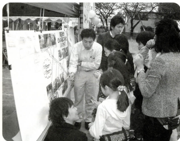
多くの方でにぎわいました

いただいたご意見は、今後のまちづくりの取り組みの参考にいたします。ご協力いただいた皆さまありがとうございました