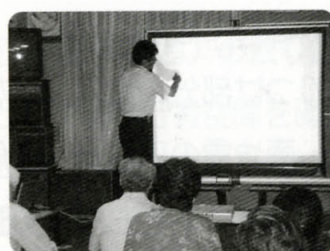
用地測量説明会の様子