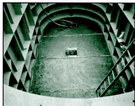
【工事途中の水槽内】

災害時の備えとして耐震型防火水槽(水量100トン)の設置工事を完了しました。(平成18年1月竣工)