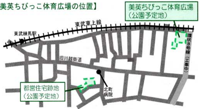
【美英ちびっこ体育広場の位置】

今後、その検討の経過や皆さんでまとめた提案の内容を、まちづくりニュースを通じてお伝えしていきます。