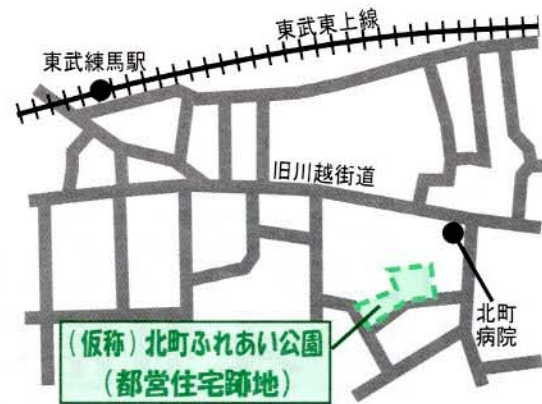
【(仮称)北町ふれあい公園(都営住宅跡地)の位置】