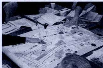
【模型キッでの配置検討】