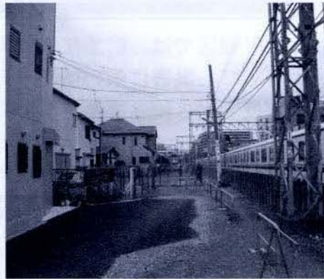
【主要生活道路2号線】