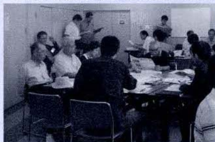
【班ごとの話し合い】