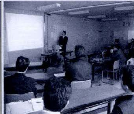
【まちづくり講座の様子】

コーポラティブ住宅とは、住む人たちが組合をつくり、土地の取得、建物の設計等を行い、管理していく集合住宅のことです。一般の分譲マンションとは違い、設計の段階から入居者が関わるため、こだわりの住まいを創ることが可能です。多数の事例を交えながら、この方式のメリットや建設過程などを紹介しました。