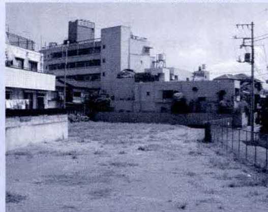
【都営住宅跡地（公園予定地）】