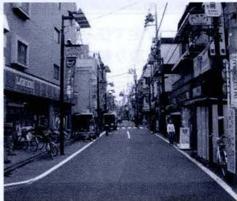
【生活幹線道路A路線】