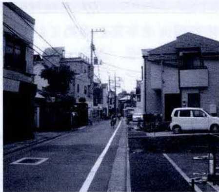
【主要生活道路1号線】