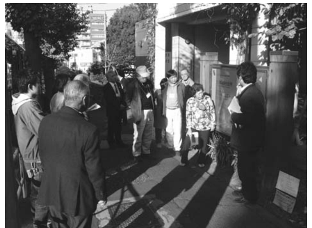
▲まちづくり見学会の様子