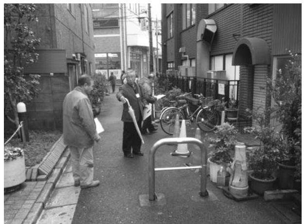
▲まちあるきワークショップの様子

住環境懇談会では、「まちあるきワークショップ」を実施し、普段見慣れたまちをあらためて見直し、まちづくりの課題を参加者で調査しました。