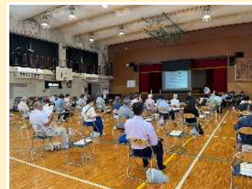
素案説明会の様子