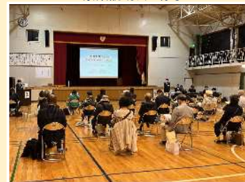
原案説明会の様子