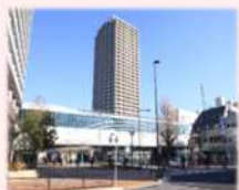
石神井公園駅北口で行われた市街地再開発事業