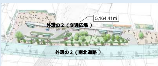
上石神井駅交通広場のイメージ

東京都と練馬区でそれぞれ物件調査・折衝を順次実施し、用地の取得を進めています。引き続きご理解とご協力をお願いします。