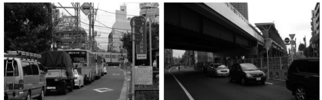
↑ 石神井公園駅周辺における事業前(左写真)と事業後(右写真)

鉄道と道路の交差部分に踏切が設置されていることにより、多くの交通問題が発生しています。この踏切を一挙に除去し、鉄道を高架化または地下化するのが『連続立体交差事業』です。こうした事業は、都内では西武池袋線やJR中央線をはじめ多くの路線で行なわれています。また、この事業に伴い、沿線・駅周辺地域では、市街地の整備やまちづくりが推進されることが多いのも特徴といえます。