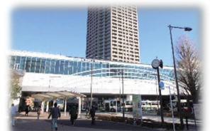
連続立体交差化のイメージ

令和3年11月に都市計画決定しました。 今後は、事業化に向けて測量等を進めていきます。