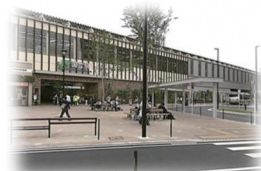
駅前広場のイメージ