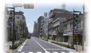
警察通りのイメージ