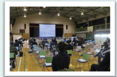
説明会の様子(10月9日 四宮小学校)