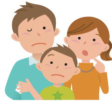
意見を伺うパネルのイメージ

パネルでお示したまちづくりの課題の中から、特に重要な課題に感じることを選んでシールを貼っていただきます。