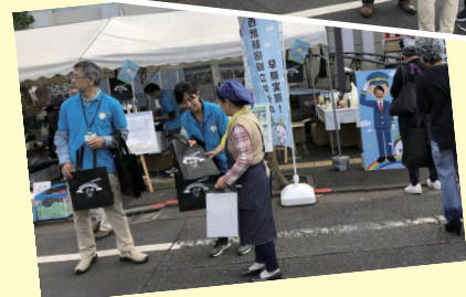
まちづくり広場のイメージ

※「新型コロナウイルス感染症に対する練馬区方針」に則り、感染拡大防止の対策を十分に行った上で運営します。お越しいただく際は、マスクの着用などにご協力をお願いいたします。