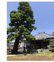
光伝寺本堂とねりまの名木「コウヤマキ」