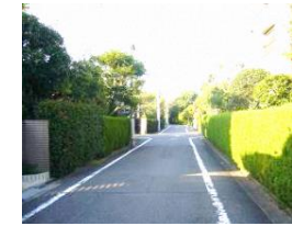
個別の敷地の緑化推進のイメージ（塀の生垣化など）