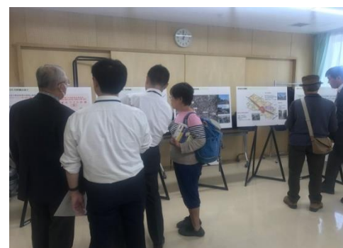
オープンハウスの様子

また、東京都第四建設事務所のホームページには、道路事業について頂いたご意見をまとめた資料が公開されておりますので、あわせてご覧ください。