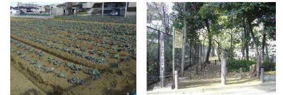
農地や民間の樹林地等の保全のイメージ