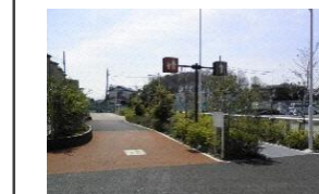
歩行者と自転車の通行分離のイメージ