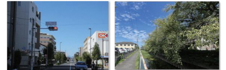
補助156号線沿道地区のイメージ