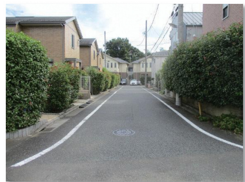
住宅地のようす (練馬区大泉町一丁目地区)