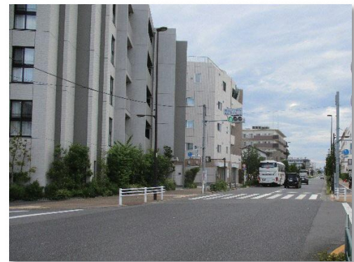
補助 230 号線沿道のようす (練馬区土支田中央地区)