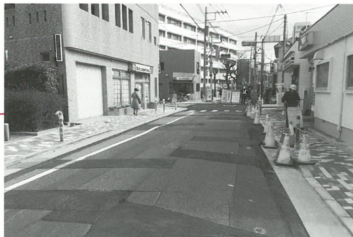
現在整備中の生活幹線道路B路線▲