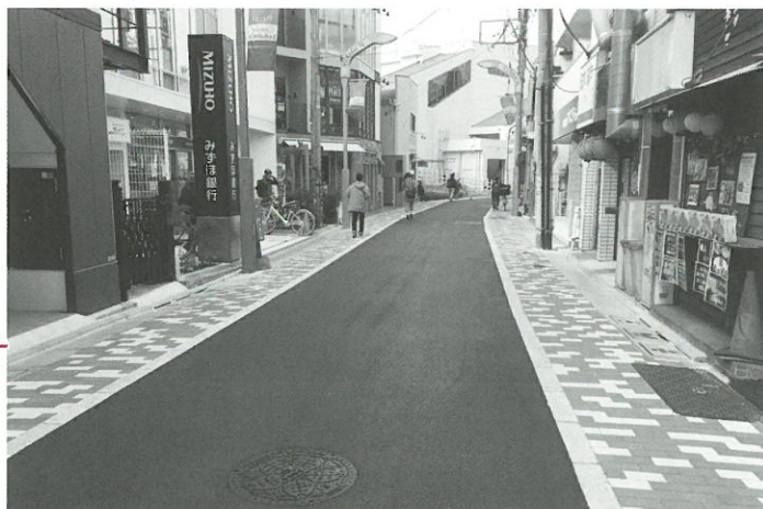
現在整備中の主要生活道路7号線▲