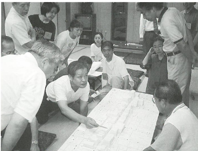
現況模型を前にまちを再認識し建物の高さや斜線など、建築の規制について意見交換しました

音大通りは、江古田北部地区の中でも道幅が狭い商店街の一つで、江古田斎場へ向かう環七からの車輛が入ってこれる唯一の通りでもあり、安全面からも、改善が必要な区域と考えられています。「江古田北部地区 密集住宅市街地整備促進事業」でも、「歩行者優先道路」として位置づけています。そこで、どのような整備がふさわしいのか、地元の方たちと一緒にその方向を考えていこうと平成12年7月から「音大通りの整備に関する懇談会」を行っています。