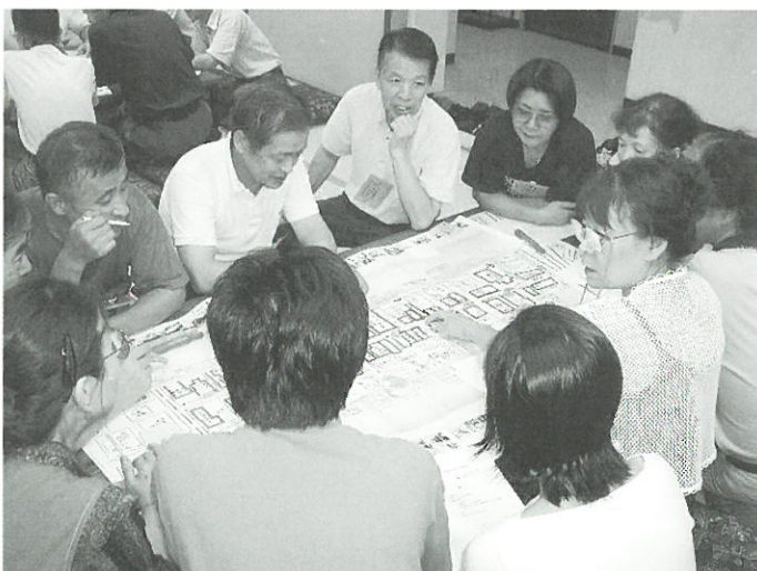
現況地図を囲んで、改善したいことや良いところ、気に入っているところなどを話合いました

2ヶ月に1回程度懇談会を開き、各回20～30名程の参加者で「現況の課題を出し合おう」、「将来像を描こう」などのテーマで、現在までに3回の懇談会が開催されました。今後も継続的に懇談会を開き、地元のみなさんの要望や希望をお聞きしながら、一緒に整備方針を検討していきます。