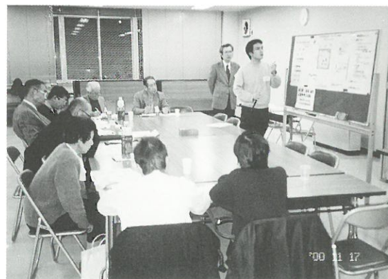
公園案をまとめているところ