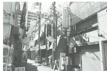
④細街路に面する建物の状況