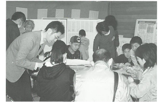
まちづくり標語コンテストの様子▲

災害はいつ起こるか分からないということで、参加された皆様は熱心に訓練に取り組まれていました。