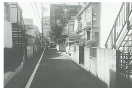
⑤住宅地に設けられた塀