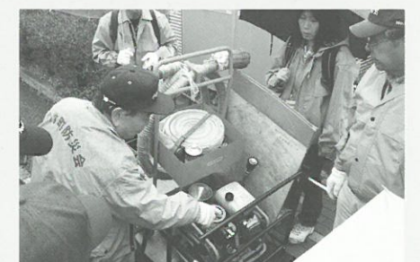
可搬式ポンプの確認▲