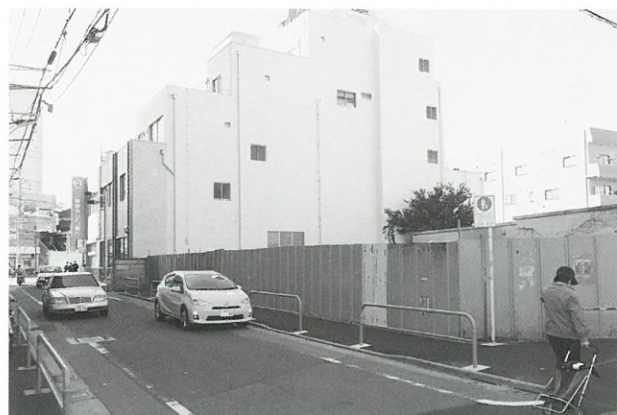
A路線5工区の用地買収状況▲

道路整備に向けて引き続き取り組んでいきますので、今後ともご理解とご協力をお願いします。