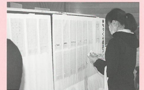
シール投票の様子▲