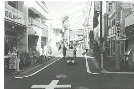
①生活幹線道路A路線5工区