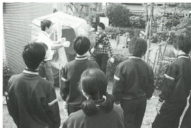
非常用トイレ説明の様子▲