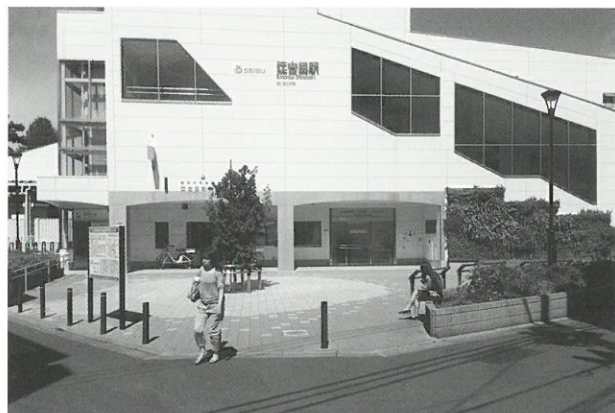
改築した江古田駅と南口の歩行者広場▶

11月より 江古田南部地区地区計画検討部会にて、検討を開始していますので、状況をご紹介します。