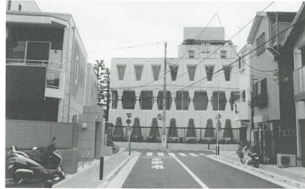
主要生活道路 A 路線▲

これらの成果をふまえて、より住みやすいまちにしていいため、密集事業に加えて地域の皆様と「地区計画」を検討し、きめ細かなまちづくりを推進してまいりたいと考えております。