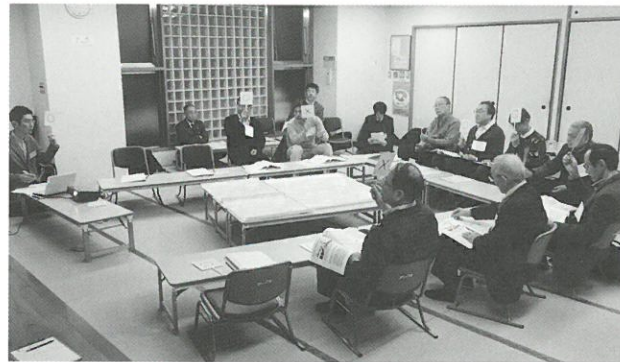
地区計画検討部会の様子▲

第1回検討部会では、密集事業による防災まちづくりの取り組みをご紹介した後、今後も大切にしたい「まちの資源」や、引き続き取り組みが必要な「まちの課題」について、皆さんからご意見を出していただきました。