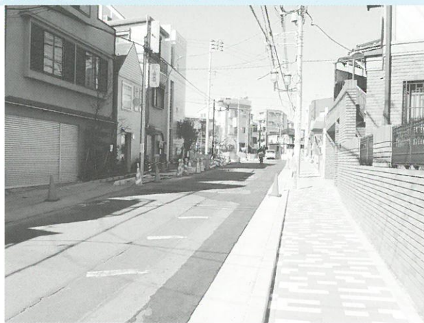
生活幹線道路A路線3工区の工事状況 ▲

工事中のため、なにかとご迷惑をお掛けしておりますが、ご理解とご協力をお願いします。