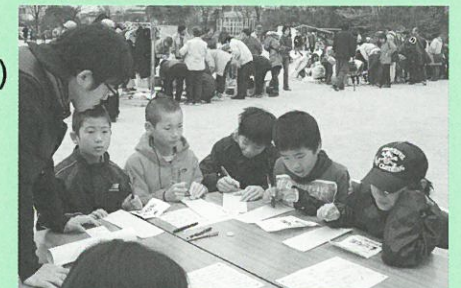
標語づくりの様子▲