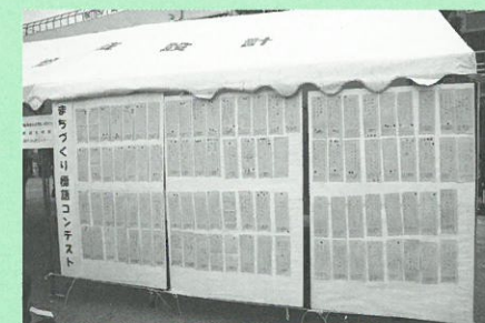
作成されたまちづくり標語▲