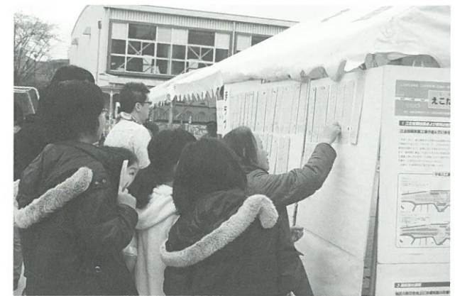
まちづくり標語コンテストの様子▲

当日は、好天に恵まれ、「まちづくり標語コンテスト」には95作品が集まりました。参加された皆様によるシール投票によって優秀賞を9作品選び、表彰を行いました。