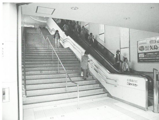
南口のエスカレーター▲