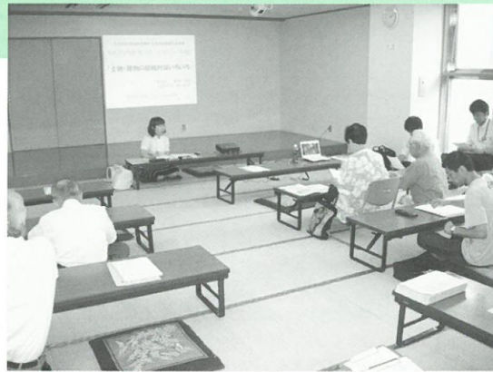
すまいづくり講座の様子▲

「すまいづくり講座」では、「土地・建物の節税対策いろいろ」と題して、平成22年度税制改正や相続対策、住宅ローン控除などについて、税理士さんにお話ししていただきました。