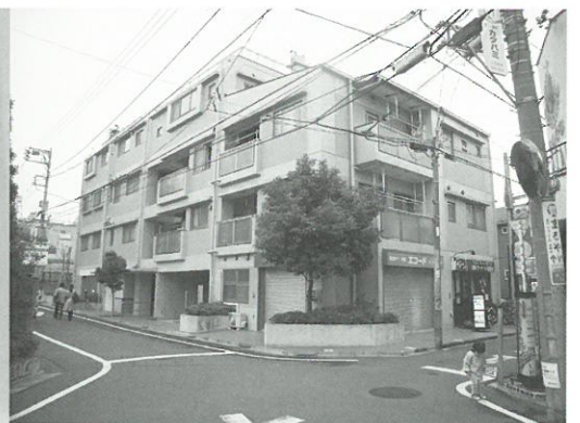
スノーベルえごた▲