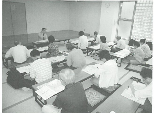
すまいづくり講座の様子▲

「すまい・建替え相談会」は、すまいづくり講座の内容に関するご質問や、拡幅整備路線沿いの方からの建替えのご相談、細街路整備についてのご相談などをお受けしました。