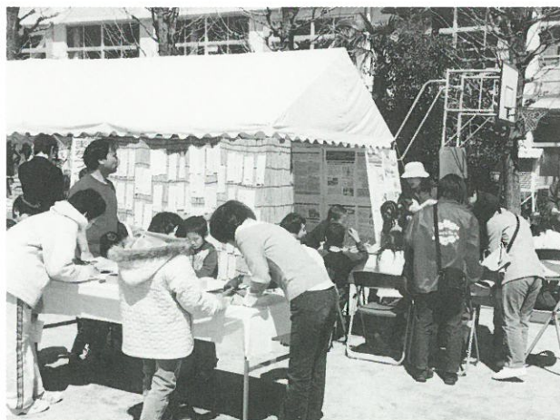
標語づくりの様子

今年は、晴天にも恵まれ、小学生の皆さんを中心に118作品の標語をお寄せいただきました。毎年ご参加いただいている方もおられ、作品のグレードも年々上がっているように思います。展示した標語について、シール投票により、優秀作品を10作選びました。今後も、楽しみながら防災やまちづくりについてお考えいただける“まちづくりワークショップコーナー”を、地元の皆さんの行事と合わせて開催できればと考えています。