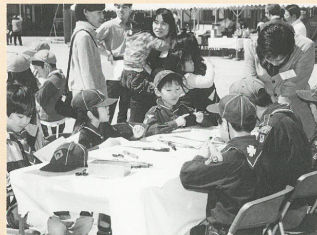
みんなで楽しく標語づくり