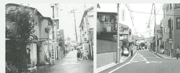
まちなみの変化も見てみましょう

開催日程や具体的な内容が決まりましたらご案内いたしますので、ぜひご参加ください。