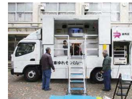
起震車で地震体験