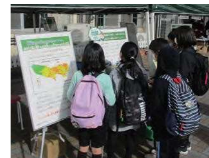
防災クイズコーナー