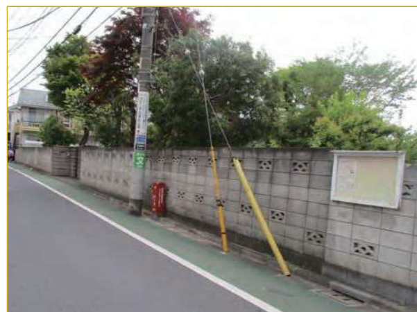
ブロック塀の撤去

人的・物的被害や道路閉そくを防止するため、倒壊の恐れがあるブロック塀等の撤去費用を助成します。