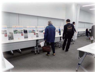
イメージ図 (パネル展示)