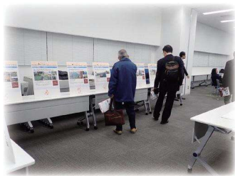
イメージ図 (パネル展示)